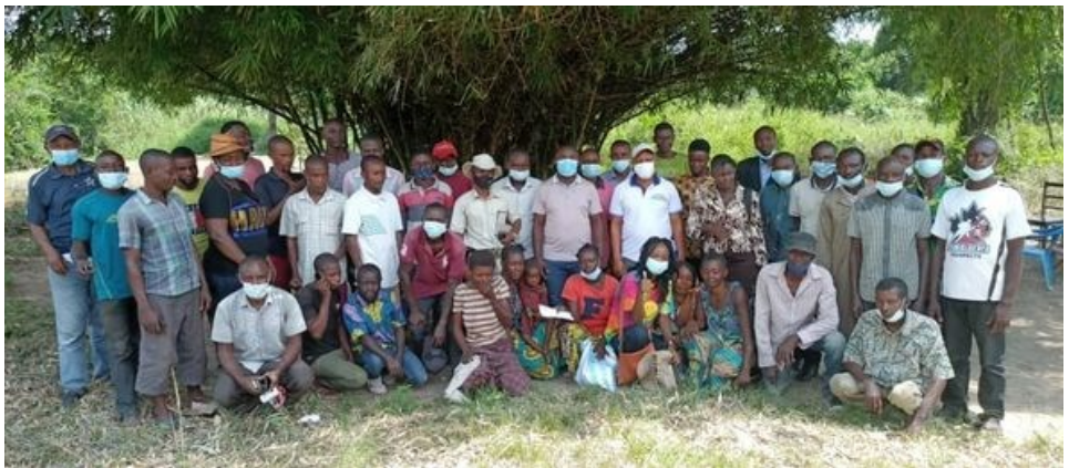
Association de l'île Mbiye.